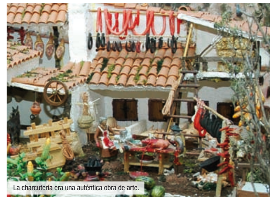
La charcutería era una auténtica obra de arte.

R.- El trabajo más artesanal ha sido obra mía. Luego un buen amigo que trabajó conmigo tiempo atrás, se encargó de la fontanería y un electricista se ocupó de la luz.