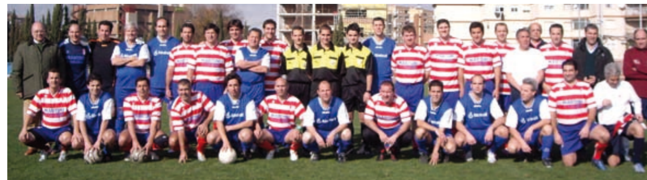
Foto de familia con los abogados.