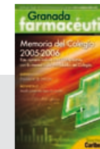
Memoria 2005-2006 y especial Ley de Farmacia de Andalucía

El inesperado cambio en la cartera de Sanidad fue uno de los acontecimientos más significativos en el segundo semestre del año. El 30 de agosto, el titular de Sanidad recibió a los miembros del Comité Directivo del Consejo General y manifestó su confianza y su intención de apoyar al máximo a los farmacéuticos, como demuestra el hecho de que fue el primer colectivo sanitario en ser recibido.