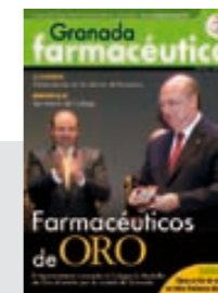
Farmacéuticos de oro

Como cada comienzo de año, Granada Farmacéutica recordó a los compañeros homenajeados durante las fiestas patronales celebradas semanas antes, en diciembre de 2006. En este número, se incluyó también un amplio reportaje en previsión de la llegada de Receta XXI, uno de los acontecimientos del año.