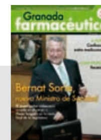
Bernat Soria, nuevo Ministro de Sanidad

En el número 8 de Granada Farmacéutica abordamos el Proyecto de Ley de Farmacia de Andalucía. El Consejo de Gobierno de la Junta aprobó el proyecto de Ley de Farmacia de Andalucía. En ese número también hicimos un despliegue especial con motivo de los 75 años de Hefagra, evento al que le dedicamos las páginas centrales de la publicación.