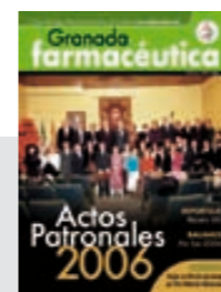
Actos Patronales 2006

Aprovechamos el comienzo del año para hacer un rápido balance de lo que fue la actividad del Colegio y del sector en 2007. Un año marcado por la publicación de la Ley de Farmacia de Andalucía en el BOJA, el dictamen motivado de Bruselas o la concesión de la medalla de oro al mérito de la ciudad de Granada al Colegio de Farmacéuticos.