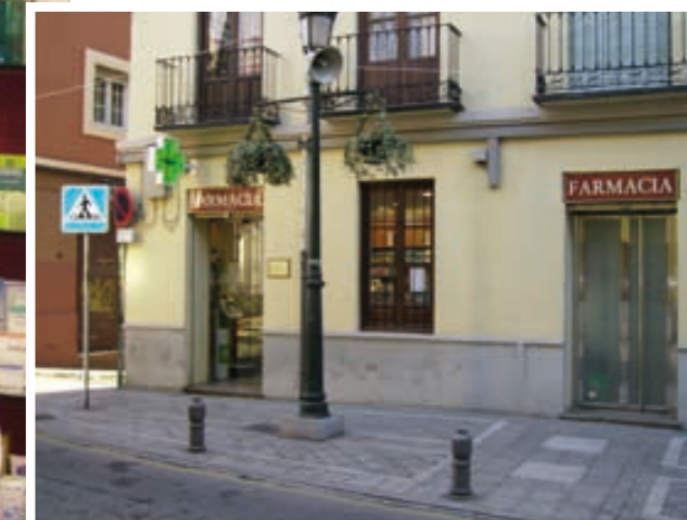
La farmacia está situada en pleno barrio del Realejo