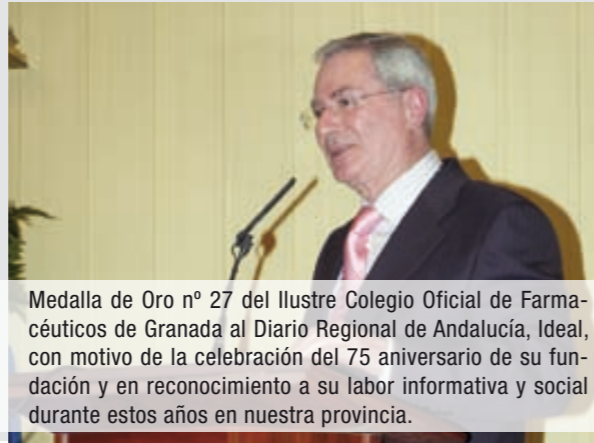
Medalla de Oro nº 27 del Ilustre Colegio Oficial de Farmacéuticos de Granada al Diario Regional de Andalucía, Ideal, con motivo de la celebración del 75 aniversario de su fundación y en reconocimiento a su labor informativa y social durante estos años en nuestra provincia.