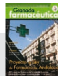
Proyecto de Ley de Farmacia de Andalucía

El 15 de marzo comenzaron las primeras dispensaciones mediante receta electrónica (o receta XXI) en Granada capital y provincia. Más de 2.550 prescripciones farmacéuticas se realizaron durante la primera semana de funcionamiento de Receta XXI.