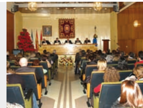
Vista general del Salón de Actos durante la celebración.