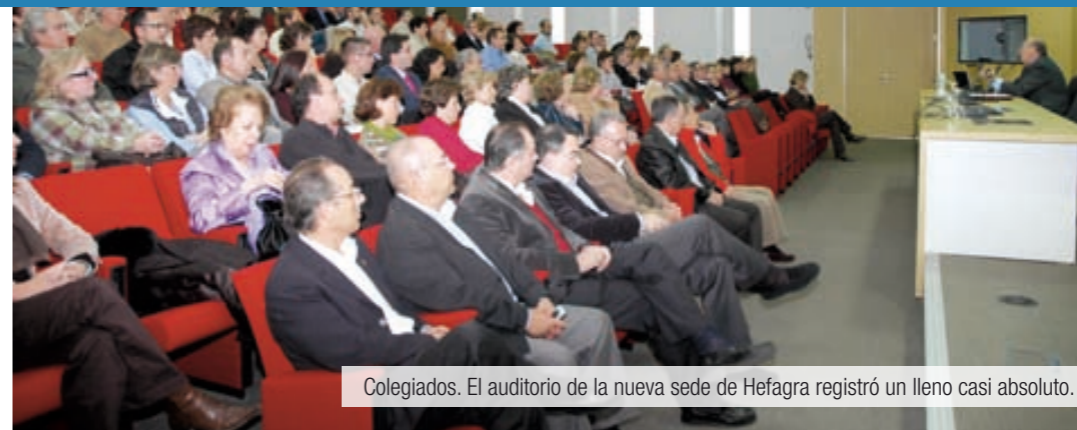
Colegiados. El auditorio de la nueva sede de Hefagra registró un lleno casi absoluto.